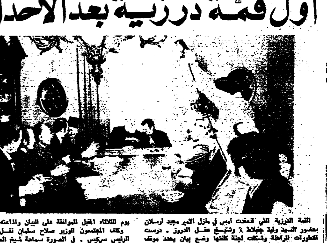
يوم الثلاثاء المقبل الموافقة على البيان وإذاعته. وكلف المجمعون الوزير صلاح سليمان نقل مطالبهم إلى الرئيس سركيس. في الصورة ساحة شيخ العقل يتراس القبة الدرزية (التفاصيل على الصفحة ٢)